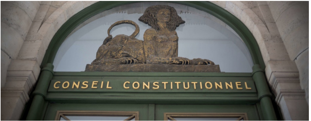
Conseil constitutionnel - Public Sénat

D'après Public Sénat, depuis septembre dernier une rumeur court selon laquelle l'exécutif pourrait avoir recours à un budget rectificatif de la Sécu. Une contrainte de forme qui l'oblige à envisager cette réforme sous un angle financier uniquement, mais qui présente un avantage certain : en cas de minorité à l'Assemblée, Élisabeth Borne pourrait recourir au 49-3 « gratuitement », sans entamer le quota de la session parlementaire qui court jusqu'en juin prochain, puisqu'il s'agirait alors d'un texte budgétaire.