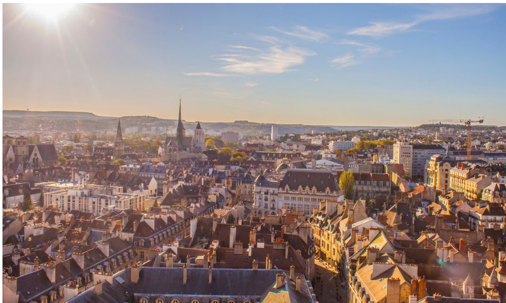
Vue aérienne de Dijon

Selon l'Agence européenne pour l'environnement (AEE), la qualité de l'air à Dijon est généralement bonne par rapport à d'autres villes de France et d'Europe. En effet, Dijon est classé 5e sur 100 au palmarès Qualité de l'air publié dans Le Point le 9 février 2023 !