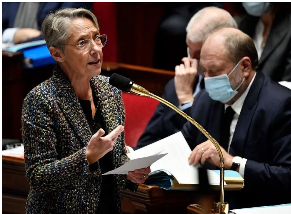
La Première ministre Elisabeth Borne présentant la réforme des retraites à l'Assemblée nationale

Le site vante également la mise en place d'un projet de justice protégeant les personnes qui ont des carrières longues et difficiles, seulement, pour ceux et celles ayant eu une carrière longue, la réforme est également injuste. Certes, si l'on a travaillé avant 18 ans, un départ à 60 ans est envisageable (avant 20 ans, un départ à 62 ans). Mais, si l'on commence à travailler à 20 ans, il faudra travailler 44 ans, soit une année de plus que tout le monde.