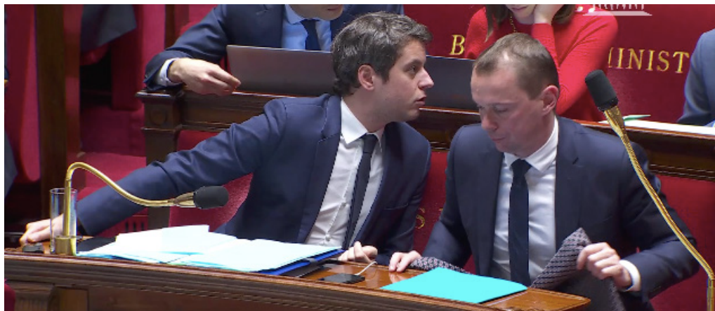
Gabriel Attal et Olivier Dussopt à l'Assemblée nationale - Le Monde

L'article a été utilisé pour la première fois sous la Ve République par le gouvernement d'Emmanuel Macron dans le cadre de la réforme des retraites de manière à faire plier l'opposition à l'Assemblée nationale. En effet, si l'article est utilisé, tout le budget de la Sécurité sociale sera soumis au Sénat, contenant la réforme des retraites dans sa version initiale avec des amendements, à la double condition qu'ils soient votés et qu'ils aient reçu un avis favorable du gouvernement.